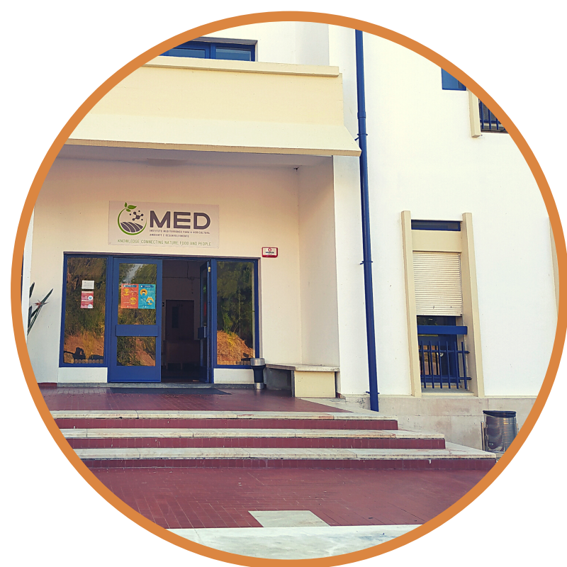
Entrada do Edifício dos Regentes Agrícolas | Pólo da Mitra