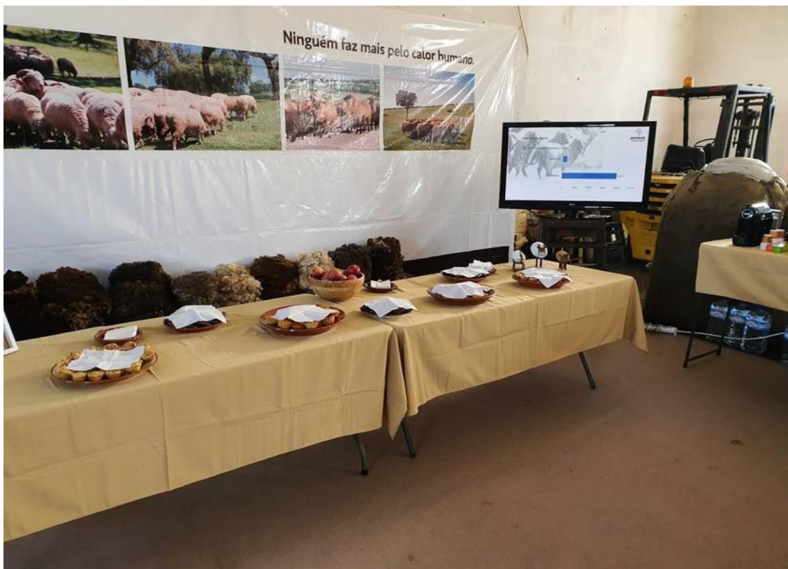
Mesa de Coffee Break