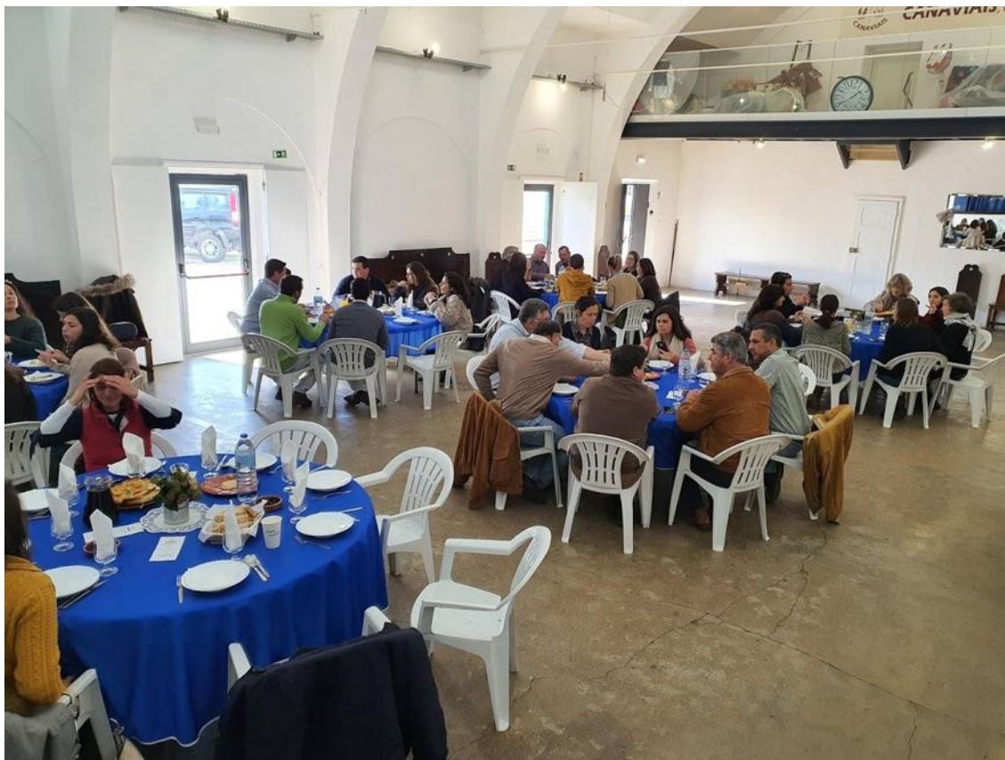
Almoço: Casa do Povo dos Canaviais – Prato Principal: Ensopado de Borrego e produtos regionais. Sobremesa – Baba de Borrego.

Os trabalhos foram desenvolvidos ao longo dos tempos e ritmos programados e todos os participantes tiveram a oportunidade para intervir e colocarem as suas questões. No final foi distribuída uma folha de avaliação do workshop.