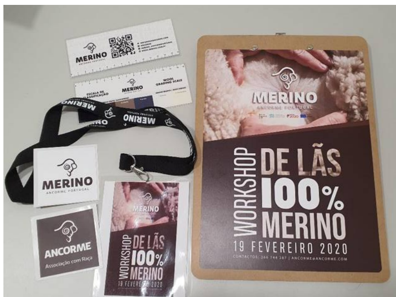
Prancheta, Régua de Classificação de Lãs, Programa/Cartaz, Fita Ancorme e autocolantes.