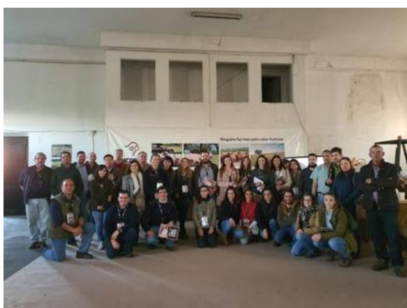
Grupo de participantes no Workshop

Os trabalhos foram desenvolvidos ao longo dos tempos e ritmos programados e todos os participantes tiveram a oportunidade para intervir e colocarem as suas questões. No final foi distribuída uma folha de avaliação do workshop.