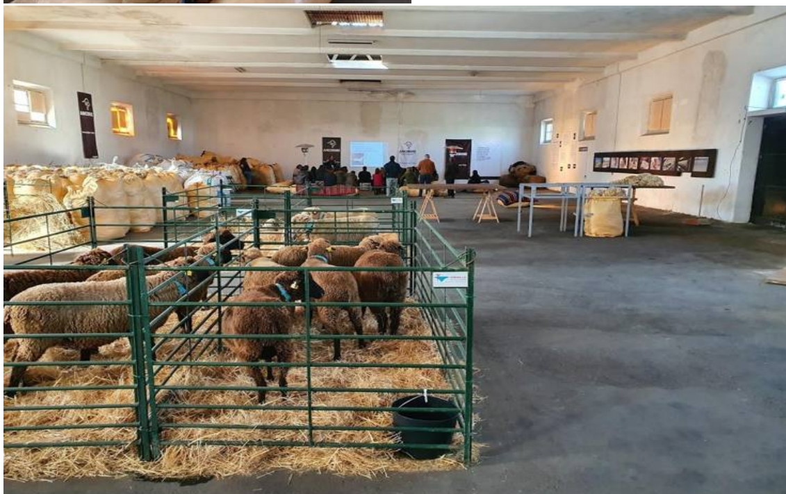
Vista panorâmica do armazém – ao fundo a zona de palestras, á direita exposição fotográfica e interativa. Mesas de classificação e tipificação. Curraletas com os animais utilizados.

Zona de palestra, exposição fotográfica e de animais, mesas de classificação e tipificação, zona de tosquia, exposição de tosquia, coffee break.