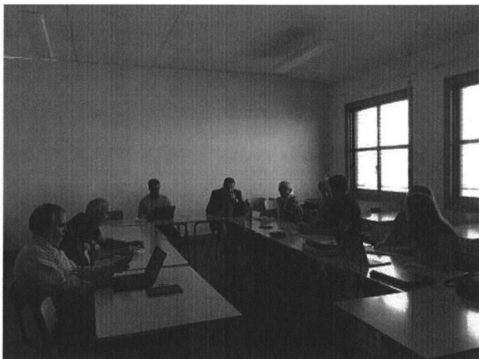
Foto 3 - Apresentação do projeto de dinamização do CCLã