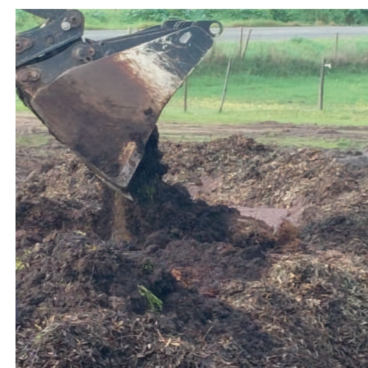
Figura 5 - Construção da pilha - Deposição estrume ovino sobre camada de bagaço húmido