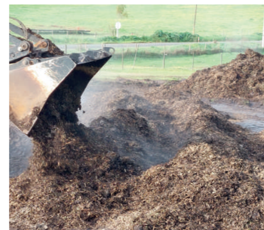
Figura 2 - Construção da pilha-deposição camada de folhas

Quando se constroem as pilhas, os diferentes materiais devem ser dispostos por camadas, importando garantir que na base fiquem os que menos se dispersam e que consigam absorver a humidade em excesso dos materiais colocado em cima (ex. folhas e raminhos ou palha).