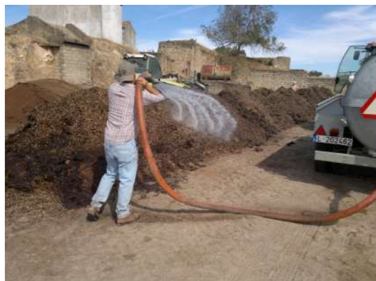
Figura 7 - Humedecimento da pilha

Monitorizar a temperatura e humidade da pilha de compostagem é uma tarefa fundamental para detetar e antecipar possíveis problemas.