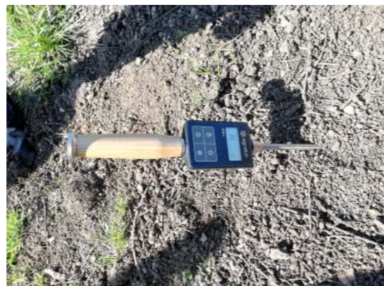
Figura 8 - Monitorização com Termohigrómetro

O centro da pilha de compostagem é o reator do processo, local onde ocorrem as temperaturas mais altas, arrefecendo em direção à superfície, pelo que é fundamental garantir que todos os materiais passam pelo centro da pilha. Assim, o tipo e número de revolvimentos é essencial no processo. Também o controle e humedecimento da pilha é um procedimento indispensável para garantir que se processe a compostagem.