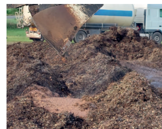
Figura 4 - Construção da pilha - Deposição bagaço húmido na vala definida com as folhas

Quando se constroem as pilhas, os diferentes materiais devem ser dispostos por camadas, importando garantir que na base fiquem os que menos se dispersam e que consigam absorver a humidade em excesso dos materiais colocado em cima (ex. folhas e raminhos ou palha).