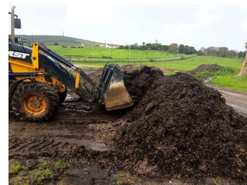
Figura 6 - Revirar a pilha

Uma vez construídas as pilhas, é importante revolvê-las de modo a promover a mistura dos materiais constituintes e regar de modo a obter o teor de humidade adequado ao início da atividade microbiológica.