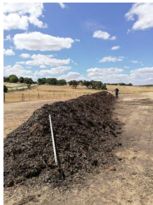
Figura 1 - Pilha de compostagem em Monforte