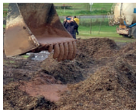
Figura 2 - Bagaço húmido (Lagares azeite de duas fases)