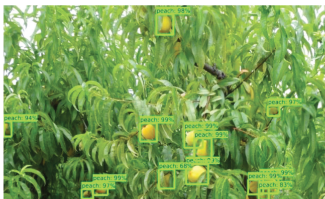
Figura 1: Resultado da aplicação do algoritmo de inteligência artificial de deep learning Faster R-CNN reconhecimento e classificação de frutos.

A Organização das Nações Unidas (ONU) prevê que, em 2050, 68% da população viva em zonas urbanas, criando a desertificação das zonas rurais e, por consequente, o abandono das atividades relacionadas com estas, como a agricultura e a pecuária. Por outro lado, o contínuo aumento da população mundial exige a produção de mais alimentos. Se a estas considerações for adicionado o efeito do aquecimento global decorrente das alterações climáticas nas culturas, tais como redução do número de horas de frio, maior escassez de água com o consequente aumento das necessidades de rega, maior risco de aparecimento de novos inimigos das culturas e irregularidade do momento de realização das operações culturais, é facilmente justificada a urgência em desenvolver novos métodos, técnicas, procedimentos e tecnologias capazes de fazer frente à escassez de mão de obra e às novas dificuldades que se vão tornando cada vez mais relevantes no futuro. Uma das áreas de investigação