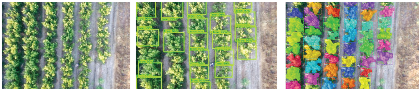
Figura 3. Resultado da aplicação do algoritmo de reconhecimento e classificação de imagens de copas de árvores obtidas por drone

estágio para propor regiões que contém objetos e outro para classificar os objetos) está a ser desenvolvido para detetar pêsegos nas árvores, para de seguida, com base na sua deteção/contagem, permitir uma previsão da produção. Trata-se de um processo complexo de automatizar pois durante a aquisição das imagens e o treino das redes, são encontradas algumas dificuldades e constrangimentos, como a variação na iluminação natural, a oclusão de frutos causada por folhas, ramos e outras frutas e as múltiplas deteções da mesma fruta em imagens sequenciais. Ainda assim, os primeiros resultados (expostos na Figura 1) indicam uma precisão média de deteção próxima de 87%.