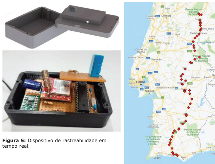
Figura 5: Dispositivo de rastreabilidade em tempo real.

Mais informações e detalhes dos grupos operacionais acima descritos podem ser encontrados na plataforma da rede de Grupos Operacionais dedicados às prunoideas, designada por goPRUNUS, disponível em: https://goprunus.wixsite.com/prunoideas