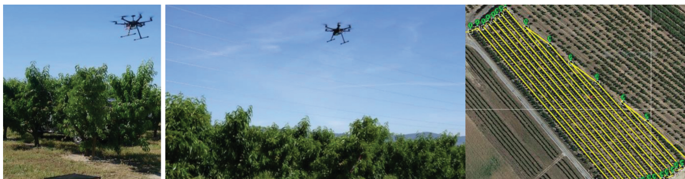
Figura 2: A, B-Drone em voo autónomo para captura de imagens da copa das plantas; B- Voo autónomo programado no Mission Planner.

Estando muitas das decisões técnicas e comerciais dos fruticultores associadas à capacidade de produção dos pomares, uma previsão acurada da produção pode constituir-se como um fator com especial preponderância na eficiência do processo de produção. Assim, no âmbito do Grupo Operacional (GO) PrunusBOT - Sistema robótico aéreo autónomo de pulverização controlada e previsão de produção frutícola (PDR2020-101-031358), financiado pelo PDR2020 procura-se desenvolver tecnologia de deteção e contagem de frutos para alimentar modelos de produção e simultaneamente atuar com precisão no controlo de infestantes. Este GO é liderado pela Universidade da Beira Interior (UBI) e o consórcio conta com o Instituto Politécnico de Castelo Branco (IPCB), com o Centro Operativo e Tecnológico Hortofrutícola Nacional (COTHN), com a Associação de Agricultores para a Produção Integrada de Frutos de Montanha (AAPIM), com a Associação de Proteção Integrada e Agricultura Sustentável do Zêzere (AppiZêzere) e com três produtores de pêsego da Beira Interior. Neste GO estão a ser desenvolvidos sistemas de deteção e reconhecimento de infestantes e de frutos, para aplicação precisa de produtos fitofarmacêuticos e caracterização da árvore e estimativa de produção, respetivamente. O método de inteligência artificial deep learning fazendo uso de redes neuronais convolucionais (Faster R-CNN) de 2 estágios (um