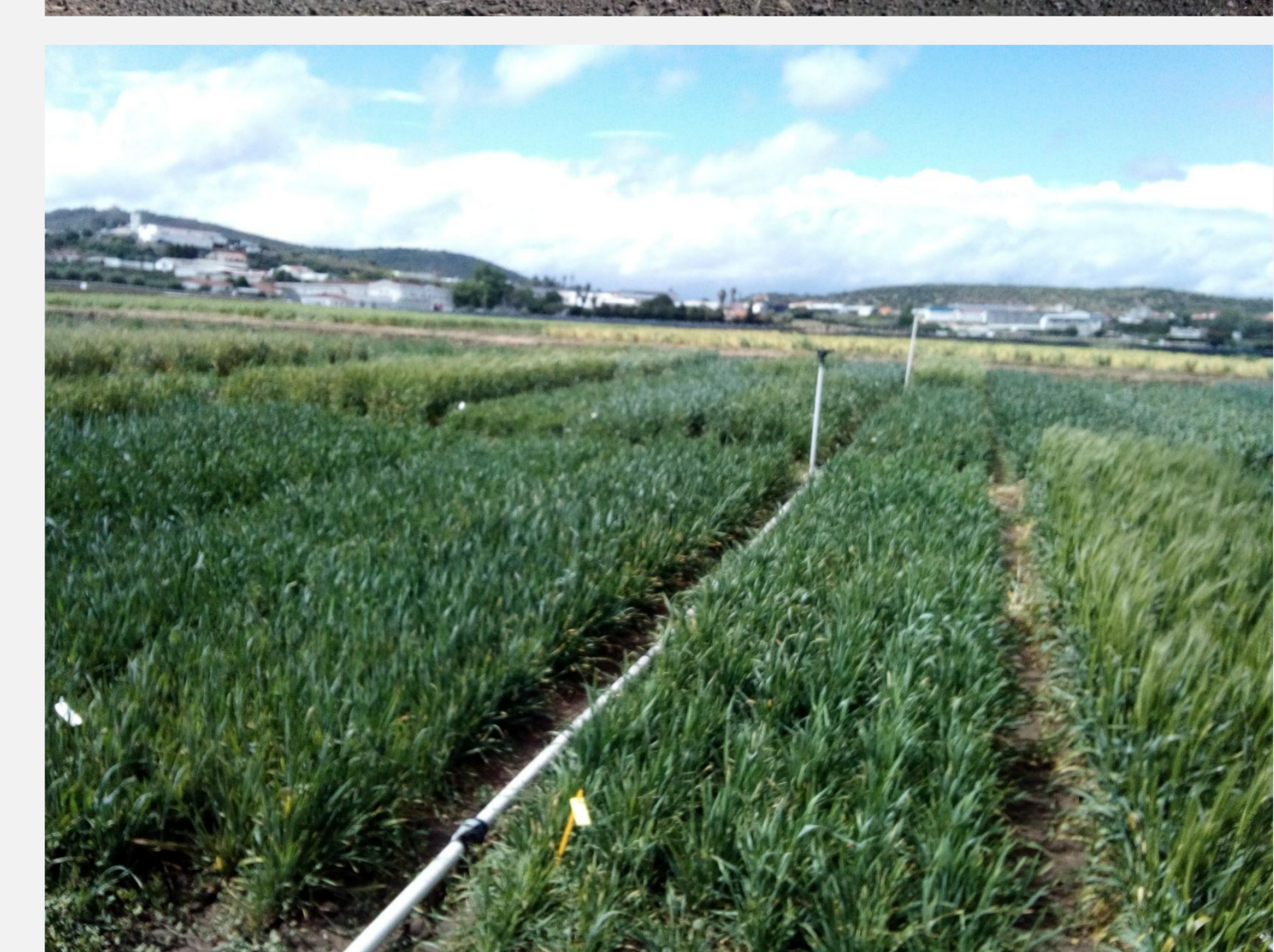
Fotografias do ensaio em Elvas, abril 2019. Fase fenológica: espigamento